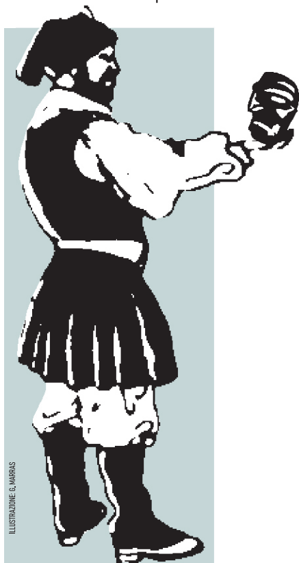
ILLUSTRAZIONE G. MARRAS